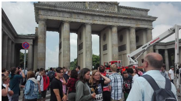
Ein ganzer Schwung, na wo? Genau-am Brandenburger Tor