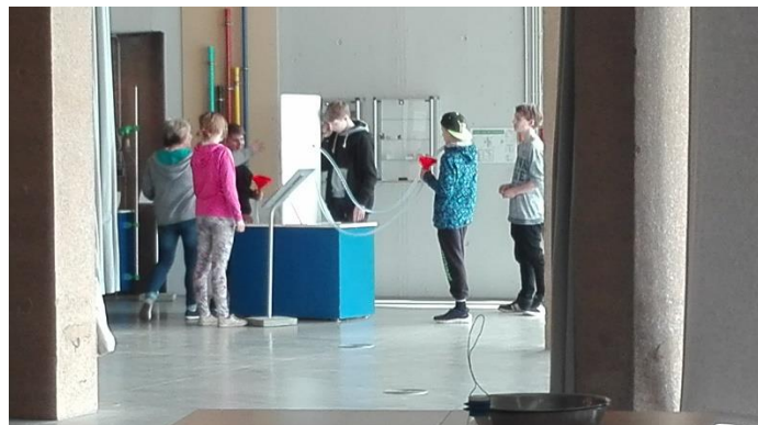
und beim Experimentieren im Wasserzentrum.