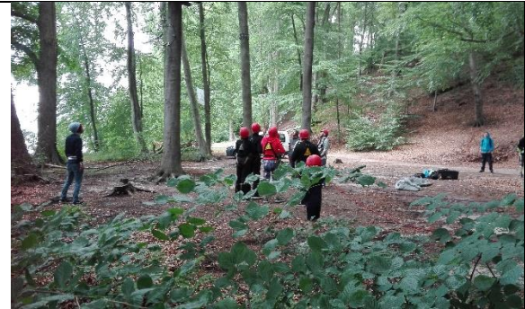
So schlimm sah es gar nicht aus, aber wenn man erstmal oben stand - oh weh.