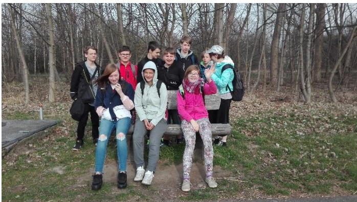
Die Klasse 8 bei einer Pause an der Goitzsche

Alle Klassen unternahmen Ausflüge in die Umgebung, nach Ferropolis oder zum Wasserturm in Gräfenhainichen oder auch ins Klärwerk. In unserer Schule ist es seit Jahren wichtig, etwas für die Verbesserung der Umwelt zu tun. Und wir können auch schon mithelfen.