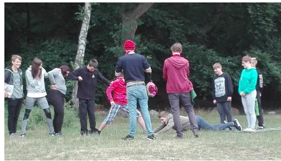
Die Klasse 8 bei der Vorbereitung aufs Klettern - oh ja, wir hatten Spaß.