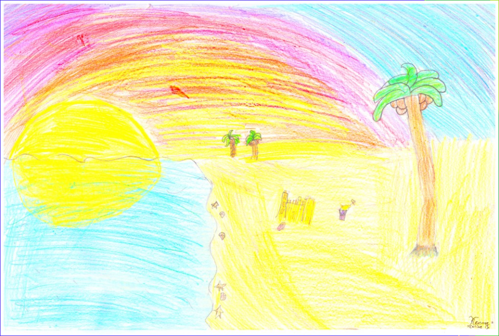
oben: Der Strand von Celine B.