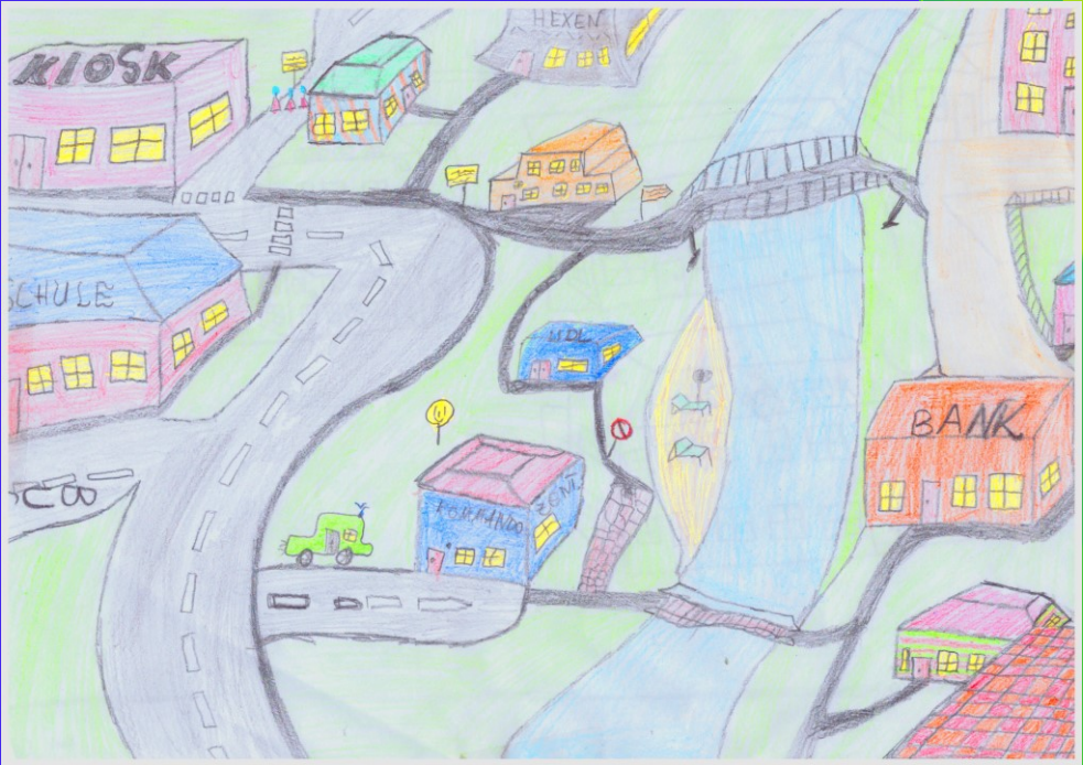
Stadtbilder von Sebastian P.